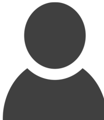
N.N. Ab 01.April?