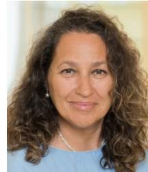
Mehtap Terim Verwaltung